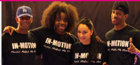
IN-MOTION DANCE CONVENTION UNE JOURNÉE DE PUR KIFF