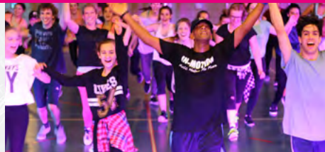
IN-MOTION DANCE CAMP 5 JOURS DE FOLIE DE LA DANSE